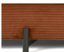
DB INDU METALL SCHWARZ