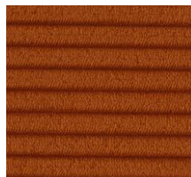
595 CORDUROY BURNED ORANGE