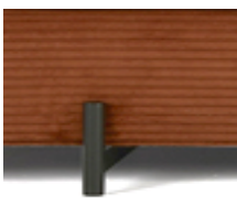
DB INDU METALL SCHWARZ