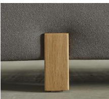
DB DRIP EICHE LACKIERT