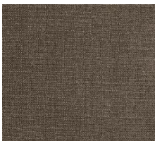
411 ESINA CEDAR BROWN