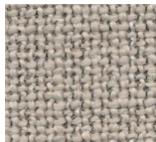
579 KENYA GRAVEL