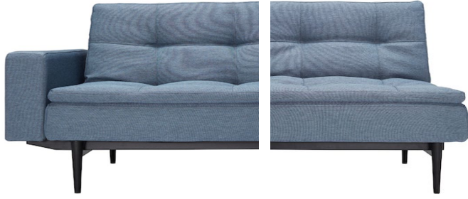
DUBLEXO mit Polsterarmlehne