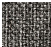
565 TWIST GRANITE