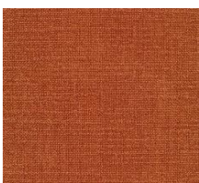
412 ESINA RUST ORANGE