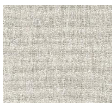
470 YUVENO NATURAL