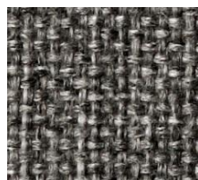
563 TWIST CHARCOAL