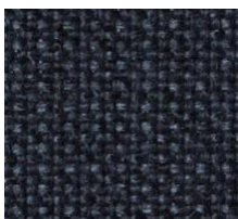
528 MIXED-DANCE BLUE