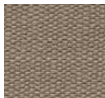
587 PHOBOS MOCHA