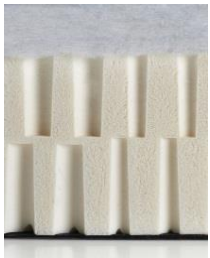
Latex NORDIC mittelfest Fiberfill Latexkern Fiberfill Gesamthöhe ca. 14 cm