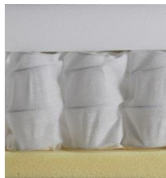
Soft-Taschenfederkern NORDIC extraweich hochelastischer Schaumstoff Taschenfederkern hochelastischer Schaumstoff Gesamthöhe ca. 18 cm

Dieses Sofabett wird in Einzelteilen geliefert. Für die Montage ist eine step-by-step Anleitung beigelegt.