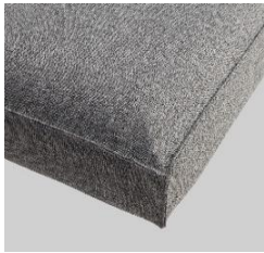
Sharp Plus Cover mit kleinem Stehsaum