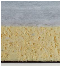
Classic NORDIC fest Fiberfill Schaumstoffkern Fiberfill Gesamthöhe ca. 14 cm