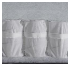
Taschenfederkern NORDIC mittelweich diverse Lagen Fiberfill Taschenfederkern Fiberfill Gesamthöhe ca. 14 cm