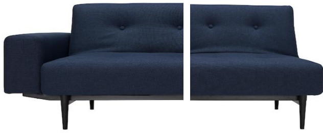
AMPLE mit Polsterarmlehne